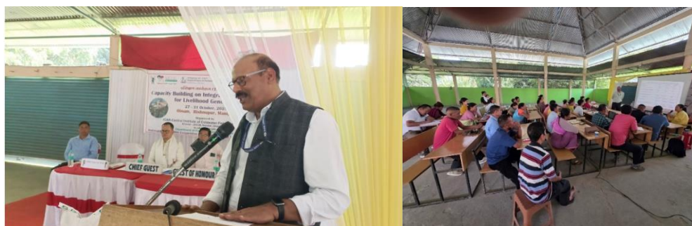
Speakers at the inaugural session and trainees fish farmers