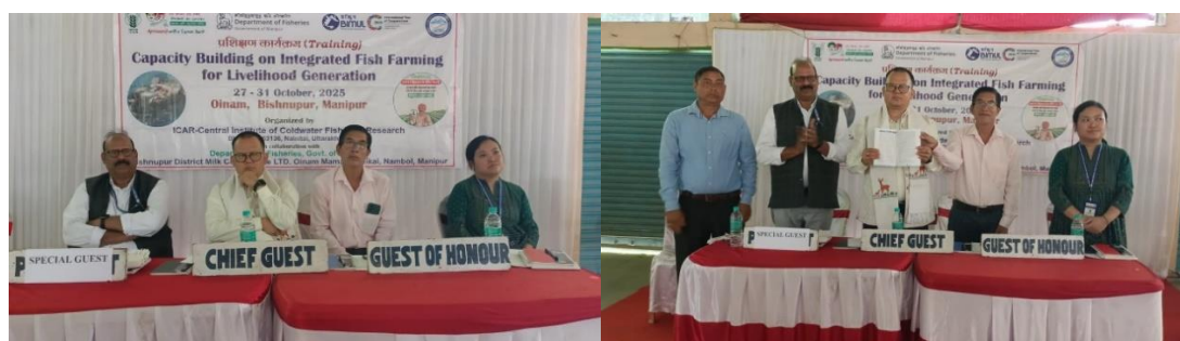
Inaugural session of the training program and release of the Bulletin on Integrated Fish Farming